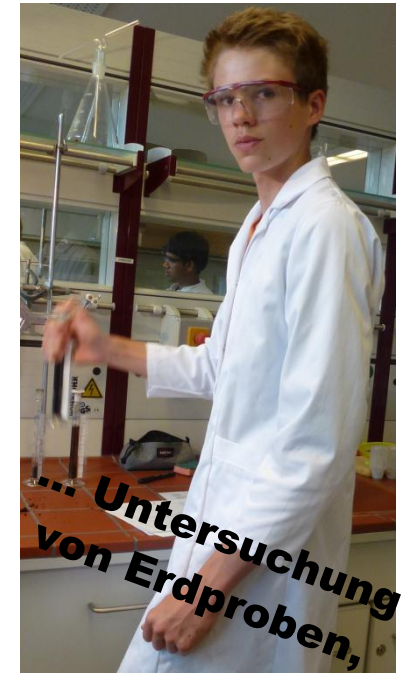
... Untersuchung von Erdproben,