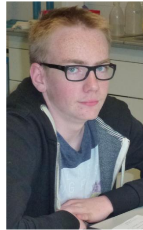
War der Bubble-Tea vergiftet?