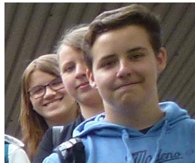
Erfolgreiche Ermittlungen dank professioneller Materialien und Geräte