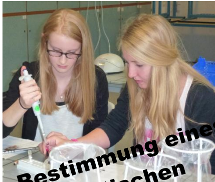
... Bestimmung eines genetischen Fingerabdrucks,