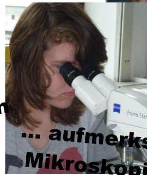
... aufmerksames Mikroskopieren,