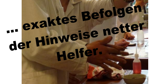
... exaktes Befolgen der Hinweise netter Helfer.