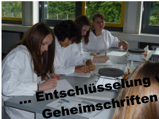
... Entschlüsselung von Geheimschriften,