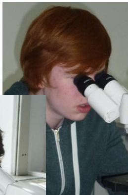
... genaues Studieren aller Indizien und