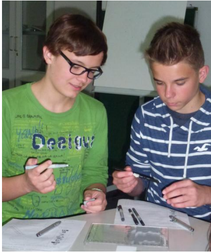
Ist das der Stift des Mörders?