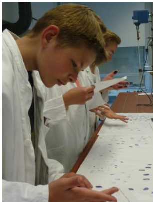
Welcher Fingerabdruck- Typ bin ich?