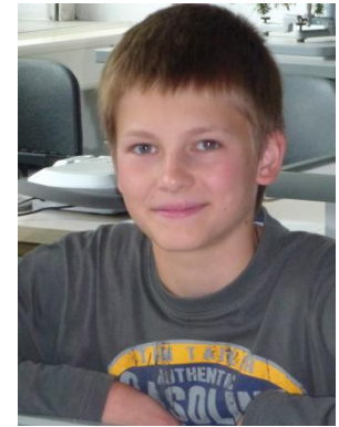
Gute Laune! Der Täterkreis engt sich ein ...